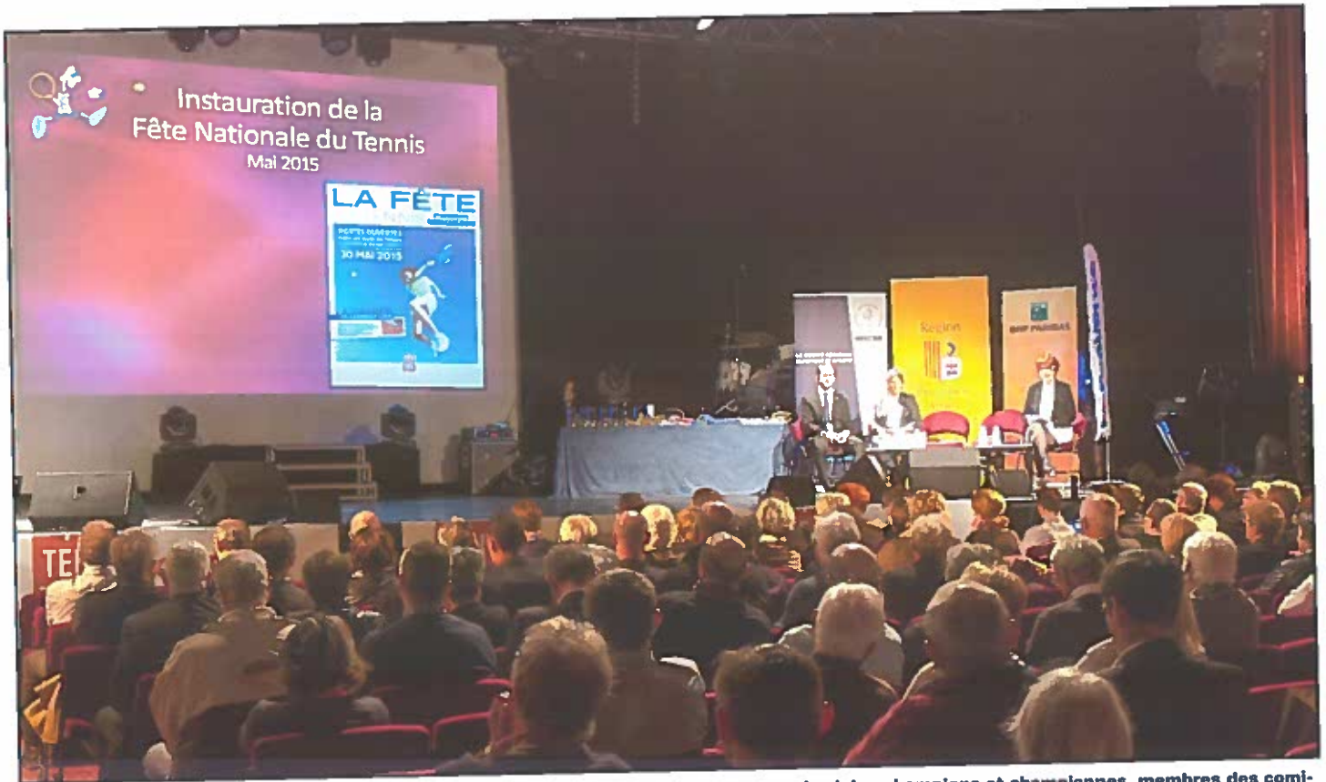
Ce sont près de 400 personnes qui ont assisté à cette Assemblée Générale : dirigeants de clubs, champions et championnes, membres des comités directeur de Ligue et de Comités Départementaux et personnalités.

En l'absence de remarque sur le compte rendu de l'AG 2014 publié dans le PTI n°384 du 7 février 2015, les délégués des clubs ont approuvé à l'unanimité le compte rendu de l'AG 2014.