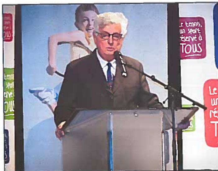
Michel Feroul, secrétaire général de la Ligue, a mis en exergue les difficultés auxquelles sont confrontés les dirigeants de club aujourd'hui.

Ces journées jeux et matches ne sont pas encore assez effectuées de manière systématique dans nos clubs, et sans journées jeux et match pas d'apprentissage du jeu et de progrès, sans journées jeux et match, pas d'évaluation de niveau.