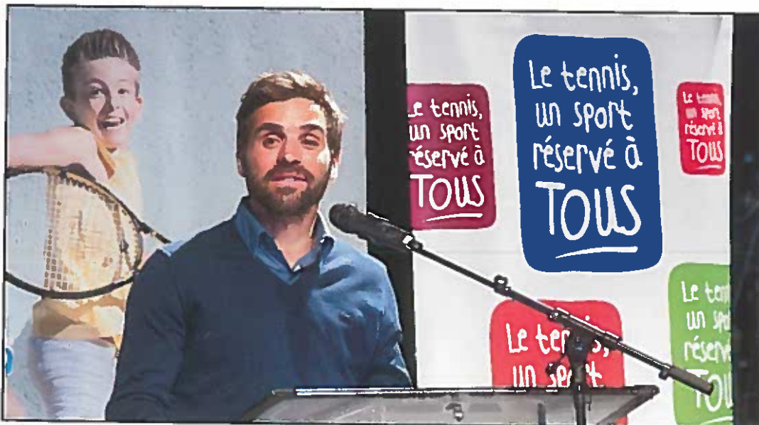
Arnaud Clément a été le grand témoin de cette Assemblée Générale. L'ancien champion français aujourd'hui directeur de l'Open d'Aix en Provence a assisté à l'ensemble de l'Assemblée Générale, adressant en clôture un message de remerciement aux clubs pour leur engagement à faire vivre le tennis auprès de tous.