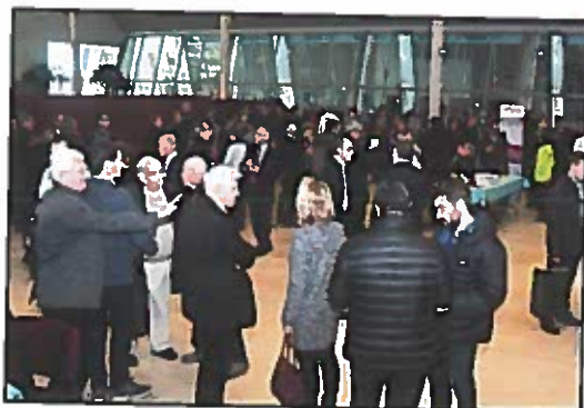
Le temps d'accueil est aussi un temps dévolu à la discussion et aux échanges autour d'un café d'accueil et auprès des présidents de commissions régionales.