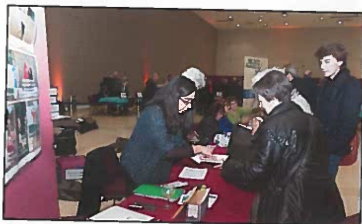
Embarquement des clubs à leur arrivée avec l'équipe administrative de la Ligue.

"de mettre les statuts de la ligue de Provence en conformité avec